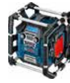
Radio GML 20 UNI Art.nr. 0 601 429 700 (utan L-BOXX)