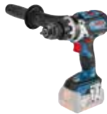
Slagbormaskin GSB 18V-85 C Art.nr. 0 601 9G0 302