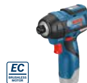
Mutterdragare GDR 12V-110 Art.nr. 0 601 9E0 003