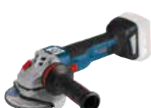
Vinkelslip GWS 18V-125 C Art.nr. 0 601 9G3 100