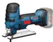
Sticksåg GST 18V-LI S Art.nr. 0 601 5A5 101