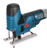
Sticksåg GST 12V-70 Art.nr. 0 601 5A1 002