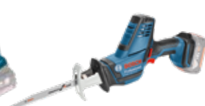
Tigersåg GAS 18V-LI Compact Art.nr. 0 601 6A5 001