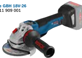
Vinkelslip GWS 18V-125 PSCT Art.nr. 0 601 9G3 F00