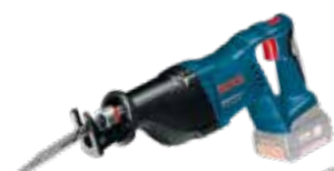
Tigersåg GSA 18V-LI Art.nr. 0 601 64J 007