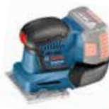
Planslip GSS 18V-10 Art.nr. 0 601 9D0 202