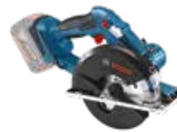
Metallcirkelsåg GKM 18V-LI Art.nr. 0 601 6A4 001