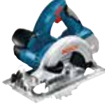
Cirkelsåg GKS 18V-LI Art.nr. 0 601 66H 006