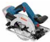
Cirkelsåg GKS 18V-57 G Art.nr. 0 601 6A2 101