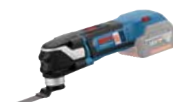
Multicutter GOP 18V-28 Art.nr. 0 601 8B6 001