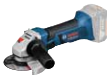
Vinkelslip GWS 18-125 V-LI Art.nr. 0 601 93A 308