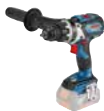
Skrudragare GSR 18V-85 C Art.nr. 0 601 9G0 102