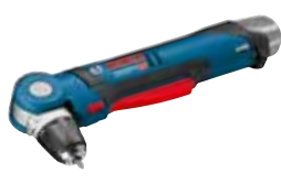
Vinkelborr/ skruvdragare GWB 12V-10 Art.nr. 0 601 390 909