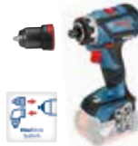
Skrudragare GSR 18V-60 C FC Art.nr. 0 601 9G7 102