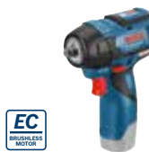
Mutterdragare GDS 12V-115 Art.nr. 0 601 9E0 102