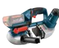
Bandsåg GCB 18V-LI Art.nr. 0 601 2A0 301