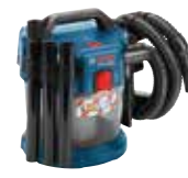
Dammsugare (våt/torr) GAS 18V-10 L Art.nr. 0 601 9C6 300 (utan L-BOXX)