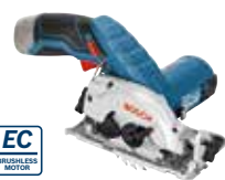
Cirkelsåg GKS 12V-26 Art.nr. 0 601 6A1 002