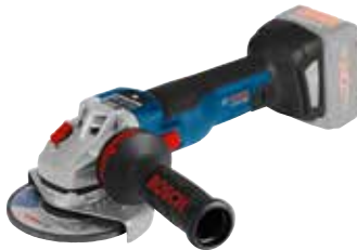
Vinkelslip GWS 18V-125 SCT Art.nr. 0 601 9G3 400