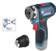
Borr-/skruvdragare GSR 12V-15 FC Art.nr. 0 601 9F6 002