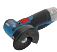
Vinkelslip GWS 12V-76 Art.nr. 0 601 9F2 003