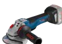
Vinkelslip GWS 18-125 PC Art.nr. 0 601 9G3 E00