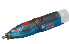
Multiverktyg GRO 12V-35 Art.nr. 0 601 9C5 002