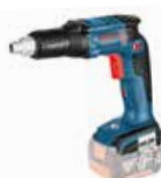
Gipsskrudragare GSR 18V-EC TE Art.nr. 0 601 9C8 004