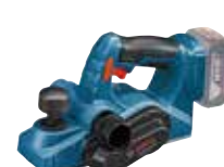
Hyvel GHO 18V-LI Art.nr. 0 601 5A0 300