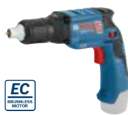
Gipsskruvdragare GSR 12V-11 Art.nr. 0 601 9E4 003