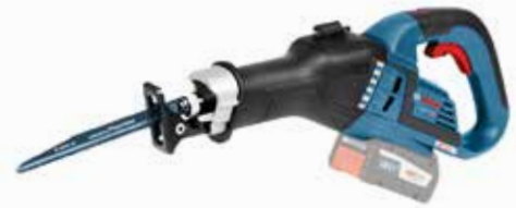
Tigersåg GSA 18V-32 Art.nr. 0 601 6A8 104