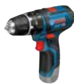
Slagborr GSB 12V-15 Art.nr. 0 601 9B6 90E