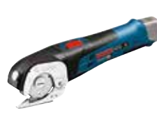
Allsax GUS 12V-300 Art.nr. 0 601 9B2 905