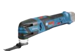
Multicutter GOP 12V-28 Art.nr. 0 601 8B5 002