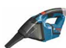
Dammsugare GAS 12V Art.nr. 0 601 9E3 001