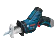
Tigersåg GSA 12V-14 Art.nr. 0 601 64L 905