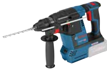
Borhammare GBH 18V-26 Art.nr. 0 611 909 001