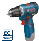
Borr-/skruvdragare GSR 12V-20 Art.nr. 0 601 9A4 003