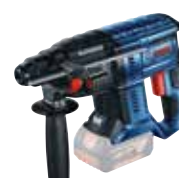
Borrhämmare GBH 18V-20 Art.nr. 0 611 911 001