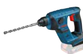
Borrhämmare GBH 18V-LI Compact Art.nr. 0 611 905 304