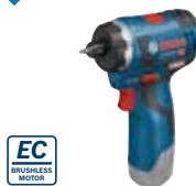
Borr-/skruvdragare GSR 12V-20 HX Art.nr. 0 601 9D4 103