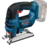
Sticksåg GST 18V-LI B Art.nr. 0 601 5A6 101