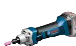
Rakslip GGS 18V-LI Art.nr. 0 601 9B5 303