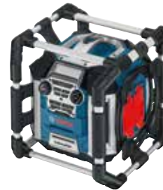
Radioladdare GML 50 Art.nr. 0 601 429 600 (utan L-BOXX)